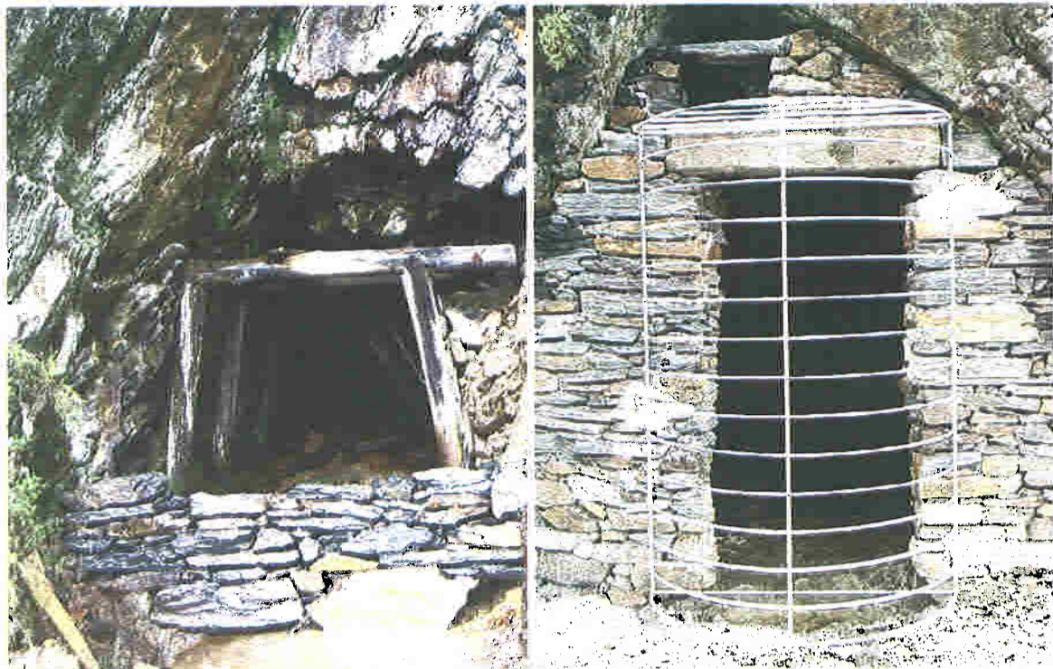
Na mina de Maria Isabel/Costas do Marão, em Vila Real, foi vedada a entrada na galeria

AMBIENTE ■ ATÉ 2013 SERÃO INVESTIDOS 118 MILHÕES DE EUROS